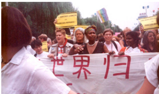
Activismo en la IV Conferencia Mundial de las Mujeres - Beijing 1995