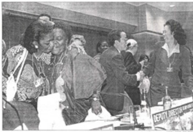
Asistentes a la Conferencia de la Mujer de Pekín se reúnen tras el acto de clausura.

condenan como violaciones de los derechos humanos prácticas tradicionales en algunos países, como la mutilación genital, y se reconoce la igualdad de hombres y mujeres en el derecho a la sucesión y la herencia.