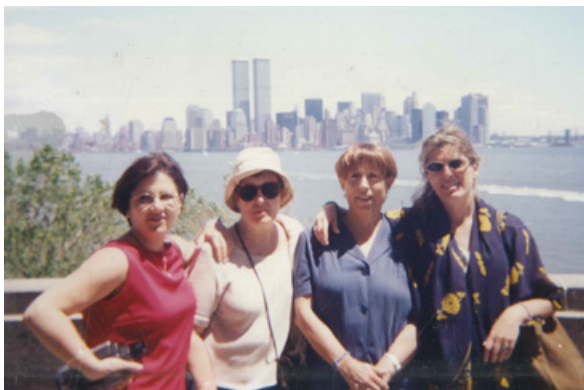
Nueva York Junio 2000 - Beijing+5