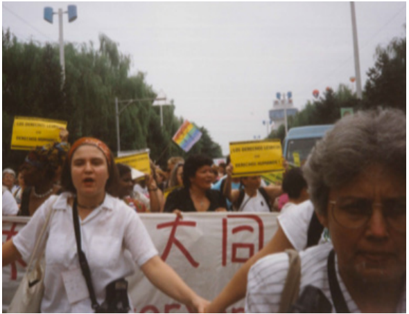
Activismo en la IV Conferencia Mundial de las Mujeres - Beijing 1995