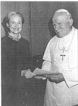
Mary Ann Glendon, con Juan Pablo II, durante una audiencia privada en el Vaticano el pasado 29 de agosto.

Sólo la comunidad internacional de Pekín, que asistió a la prensa de Hong Kong, pudo ver la noticia del día, con la que abrió el programa de la conferencia, el South China Morning Post, que se ve desde Beijing en el país.