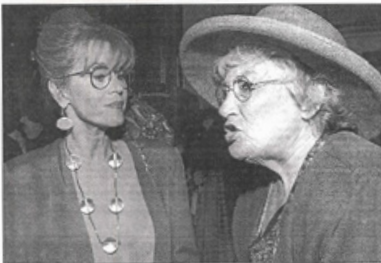
Jena Fonda conversa con la senadora feminista americana Betty Abzug, de 78 años.

Por tercera vez desde que se inició el foro, en el que han participado más de 20.000 mujeres, la ministra española, que actúa como portavoz de la Unión Europea en la Conferencia de Pekín, anunció los apoyos de las mujeres representantes de las ONG de todo el mundo. Alberdi clausuró el plenario de "estrategias de futuro" que inauguró la primera dama de los Estados Unidos, Hillary Rodham Clinton, y que estuvo en esta ocasión dedicado al debate intergeneracional entre mujeres. El objetivo del plenario fue reunir a las actuales y futuras líderes feministas para ahondar en sus puntos comunes con vistas a un movimiento global. En su discurso, Alberdi reconoció el "temper" de las mujeres de las ONG y del movimiento asociativo mundial que han estado presentes en las cuatro conferencias de la ONU sobre la mujer celebradas en México, Copenhague, Nairobi y Viena el 15 de septiembre en Pekín. La representante de la Unión Europea señaló que en ningún país del mundo las mujeres tienen las mismas oportunidades y recordó que existen 1.300 millones de mujeres pobres, "lo que representa el 70 por ciento de las personas que se sitúan en las situaciones más difíciles de la civilización mundial de la época". Alberdi pidió que "redefinamos la perspectiva de género" en todos los programas de