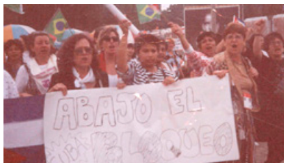
Activismo en la IV Conferencia Mundial de las Mujeres - Beijing 1995