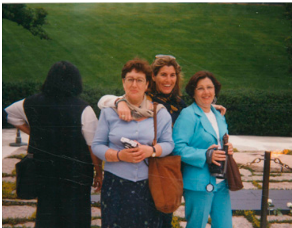
Activismo en Beijing+5 - Nueva York 2000