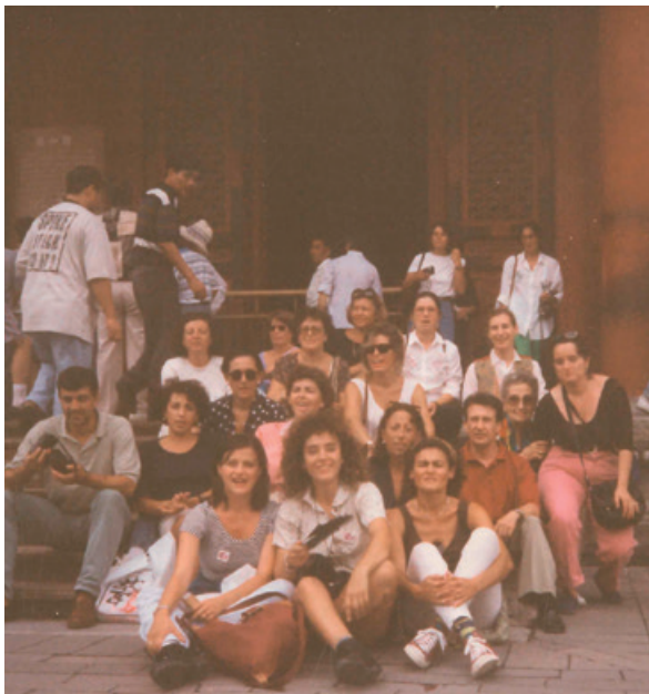
Activismo en la IV Conferencia Mundial de las Mujeres - Beijing 1995