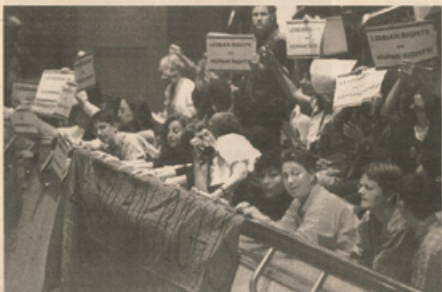
PROFESORA Un grupo de lebanitas reivindica sus derechos bajo el lema "sus derechos humanos".

El atrazo en las negociaciones es tal, que los grupos de trabajo deberán seguir atascados durante el fin de semana para que el calendario sucesivo previamente se