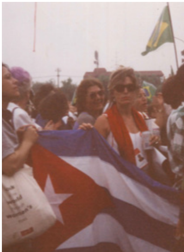
Activismo en la IV Conferencia Mundial de las Mujeres - Beijing 1995