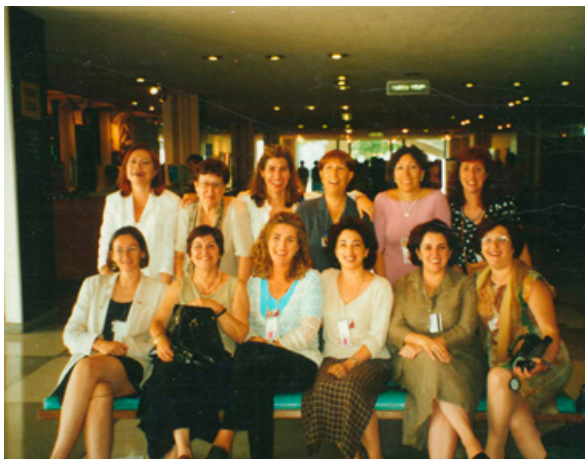
Activismo en Beijing+5 - Nueva York 2000