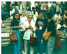
Activismo en la IV Conferencia Mundial de las Mujeres - Beijing 1995