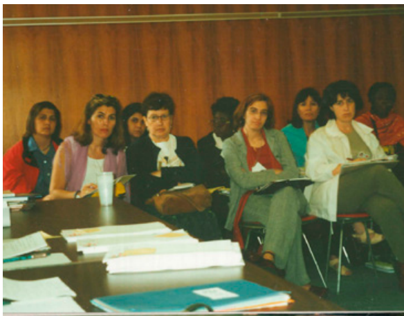
Activismo en Beijing+5 - Nueva York 2000