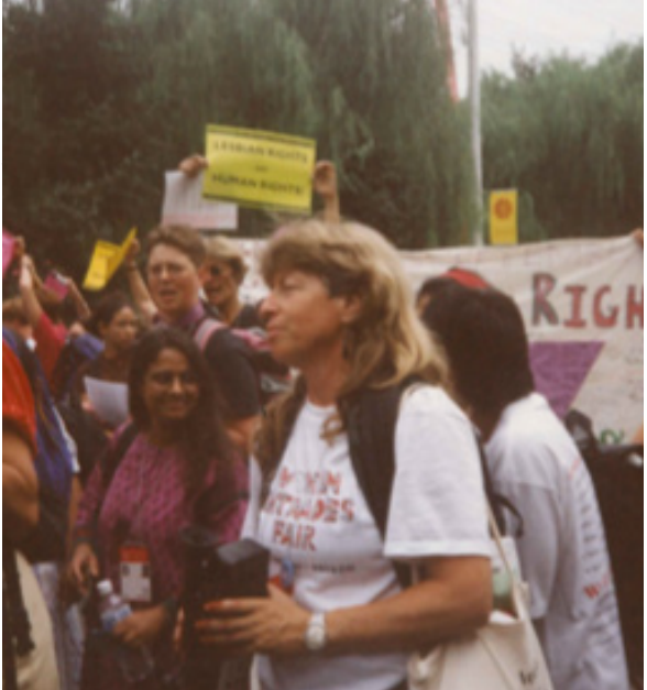
Activismo en la IV Conferencia Mundial de las Mujeres - Beijing 1995