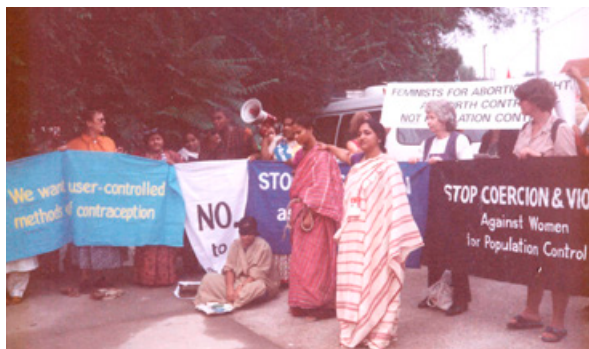
Activismo en la IV Conferencia Mundial de las Mujeres - Beijing 1995